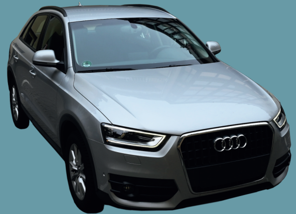
PKW AUDI, Typ "Q3", Baujahr 2014, Benziner, TFSI, Automatik, ca. 17.260 km Lot 3906