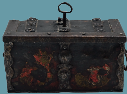
Eisenkästchen/ Geldkassette wohl 17./18.Jh., Deckelschloss, 2 Handhaben, Reste von Bemalung Lot 2041