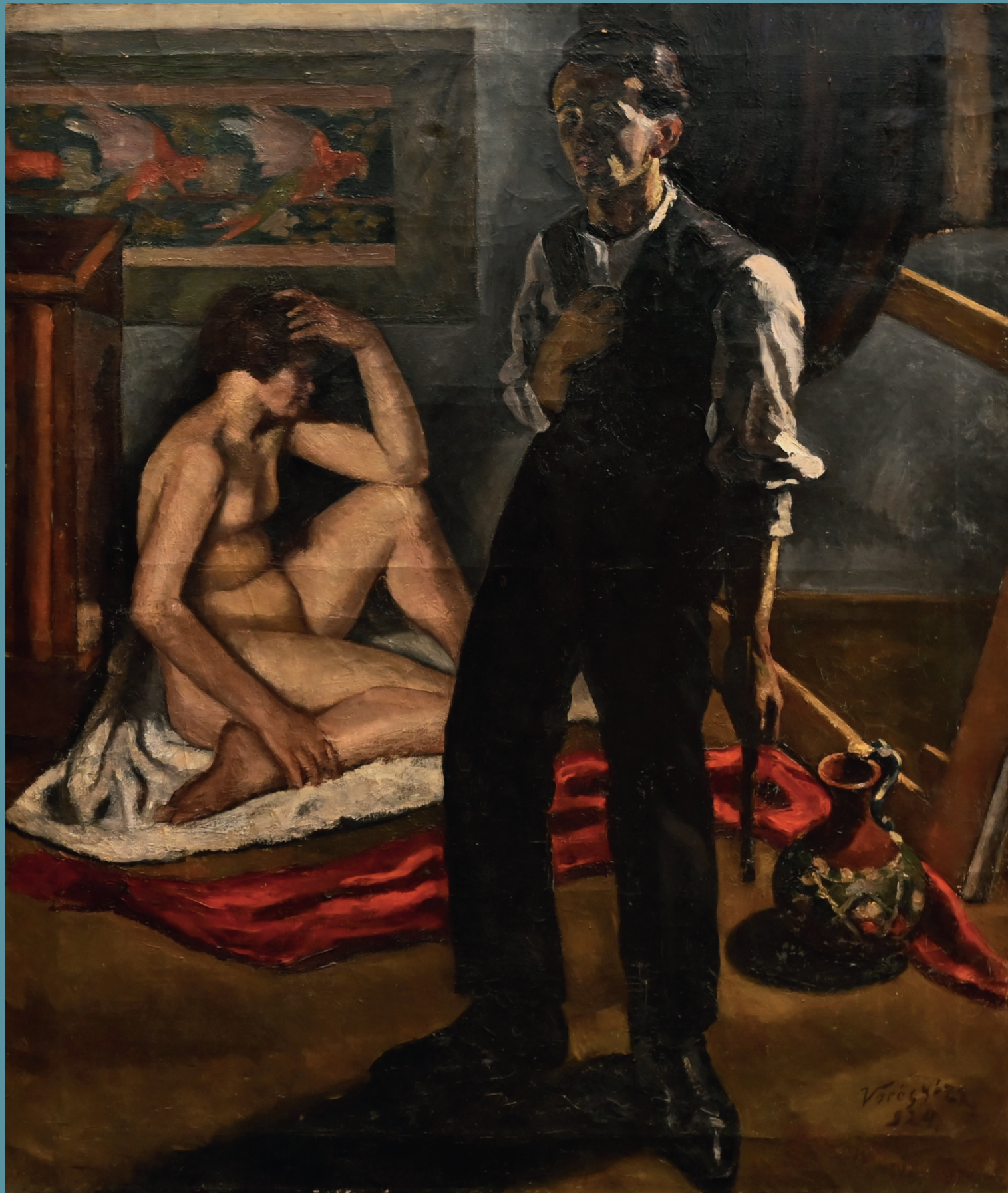
Lot 4010: Ölgemälde r.u. sign. Vörös Géza (wohl Geza VÖRÖS 1897 Welyka Dobron-1957 Budapest) "Im Atelier - Maler mit seinem Model", dat. (1)924

seit 1980 Top-Adresse für alle Sammlungsgebiete öffentlich bestellte und vereidigte Auktionatoren