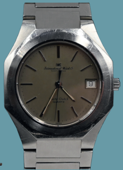
Armbanduhr IWC "Yacht Club II", Quartz, Edelstahl, in Original- oder Reiseschutulle - Lot 805