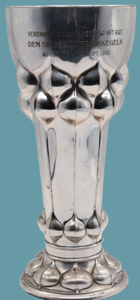
Pokal Silber 835 Wilhelm BINDER, Schwäbisch-Gmünd, auf Wandung bez. "Dem Sieger im Preis Kegeln", "Vereinigung 8. Bayr. Res. Feld Art. Rgt./ Augsburg am 4. Sept. 1930" - Lot 2820