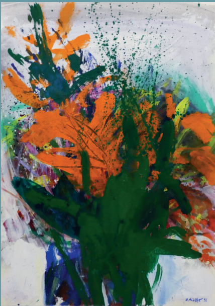
Ölgemälde r.u. sign. O. KOLLER (wohl Oskar K. 1925 Erlangen - 2004 Fürth), "Farbexplosion in grün und orange", dat. (19)92 - Lot 4109